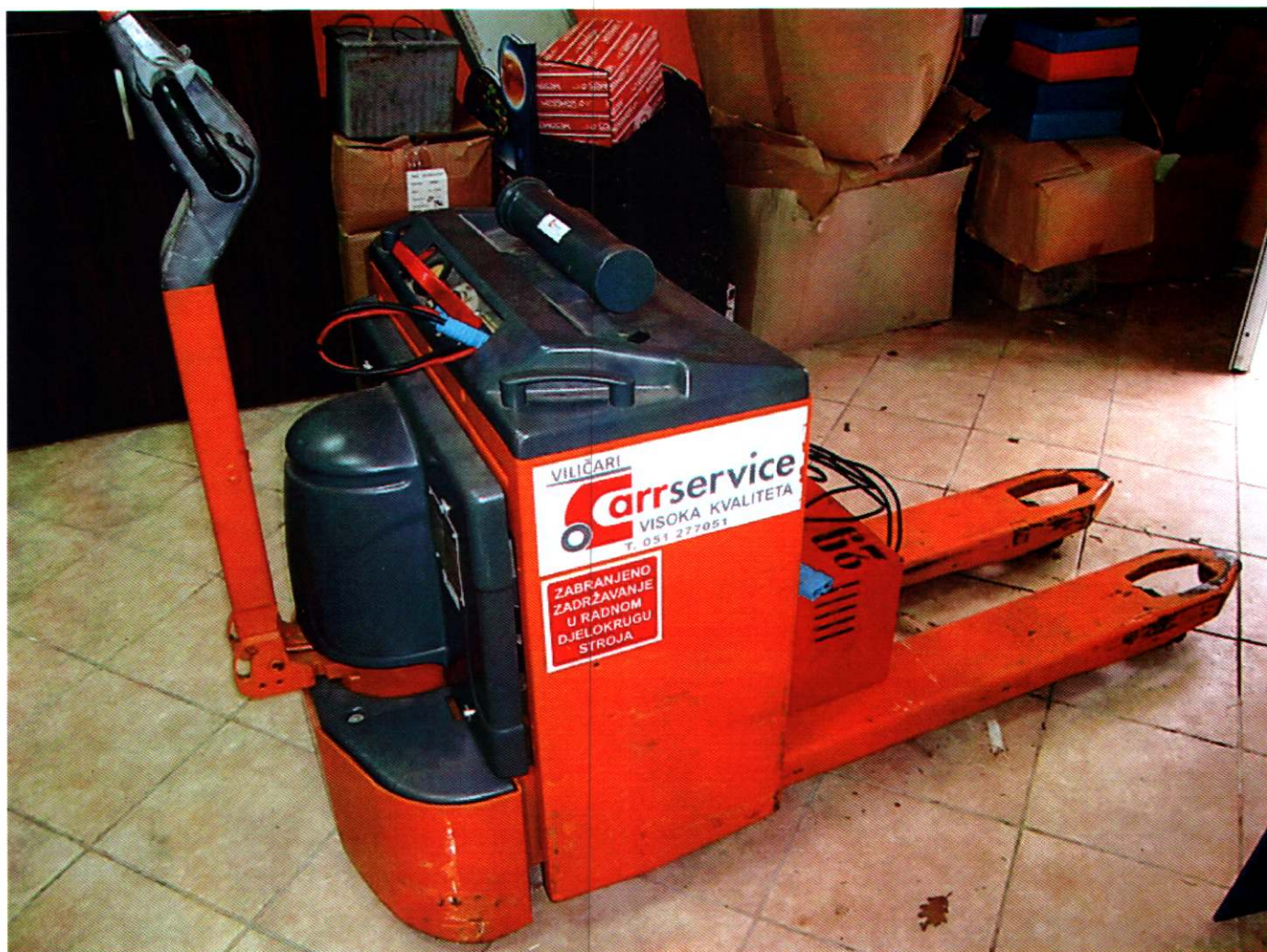
10. VILIČAR-PALETAR, baterijski, m. OMG, tip. 320 KN, nos. 2T