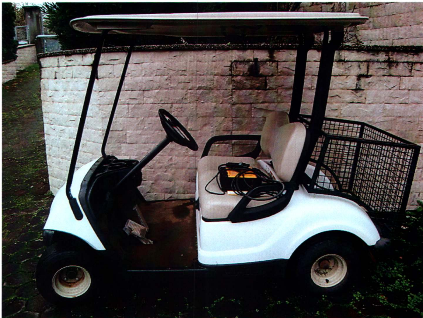
9. PAPA MOBIL - Elektro vozilo za rublje, baterijski, m. YAMAHA, mod. YDREX5