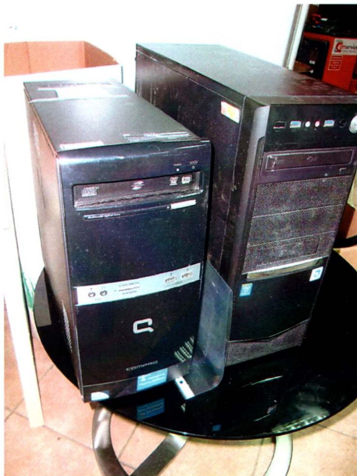
5. OSOBNO RAČUNALO + MONITOR