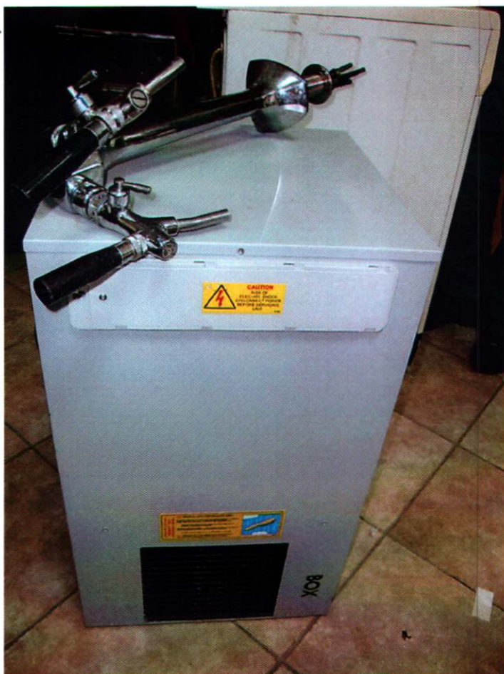
2. APARAT ZA ISTAKANJE VINA, m. OPREMA