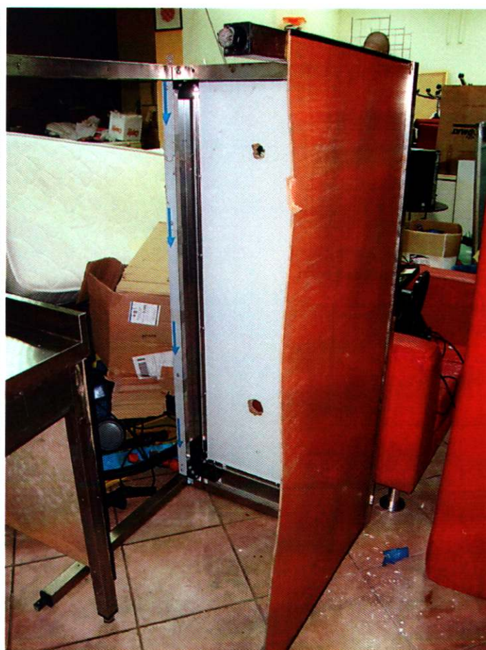
8. RADNI STOL, br.3