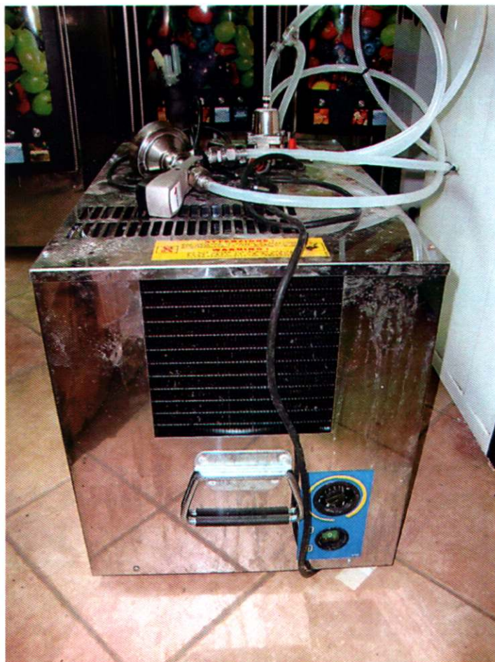
3. APARAT ZA SOKOVE, neispravan