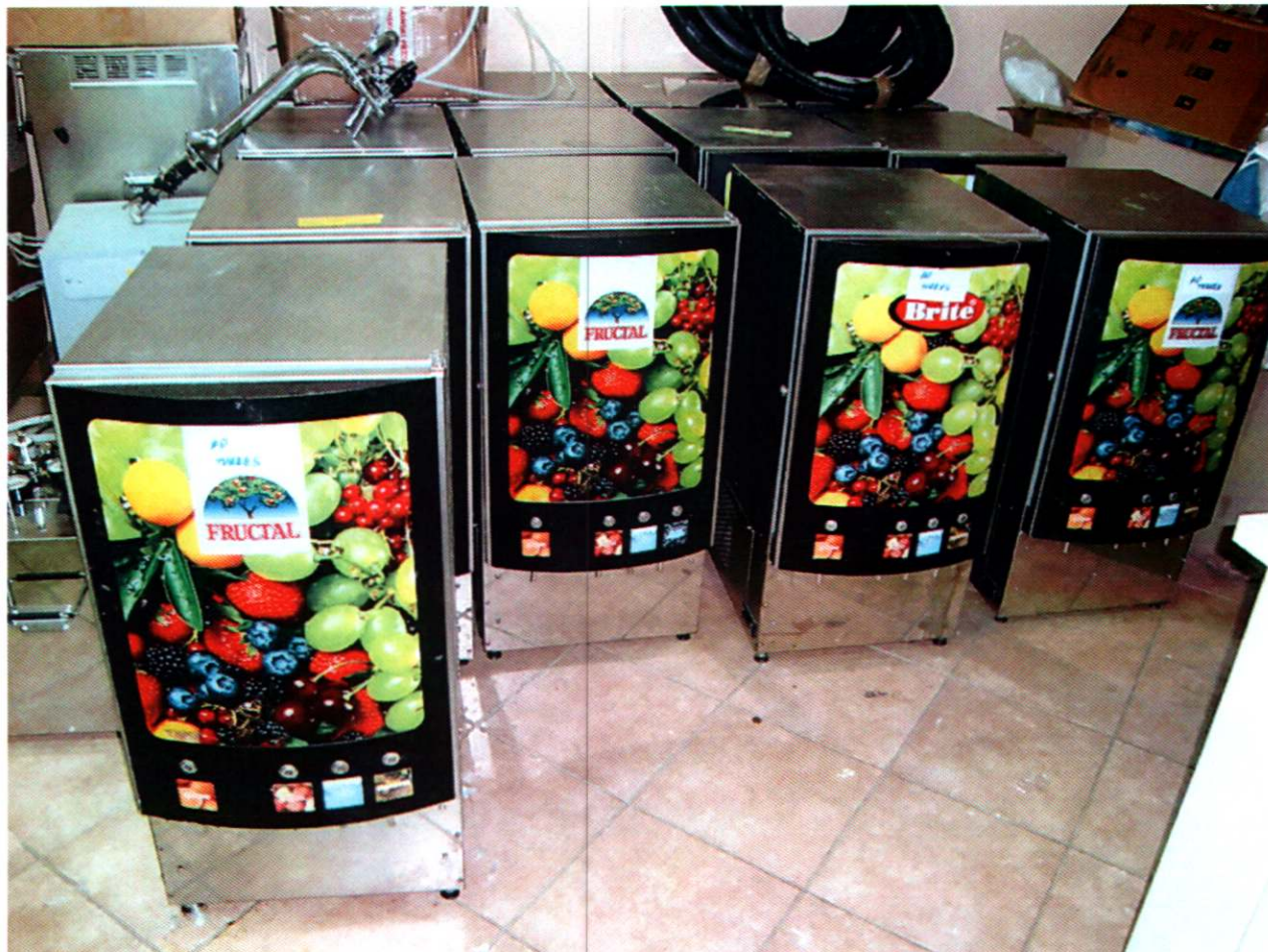
1. APARAT FRUIT SISTEM 3, m. BERBEX