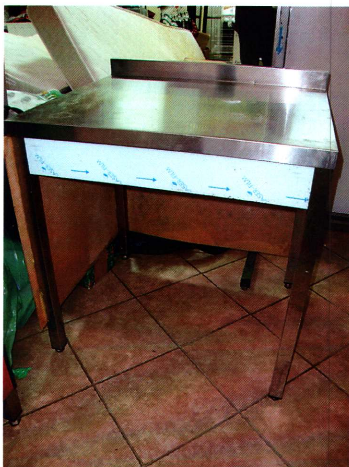
7. RADNI STOL, br.2