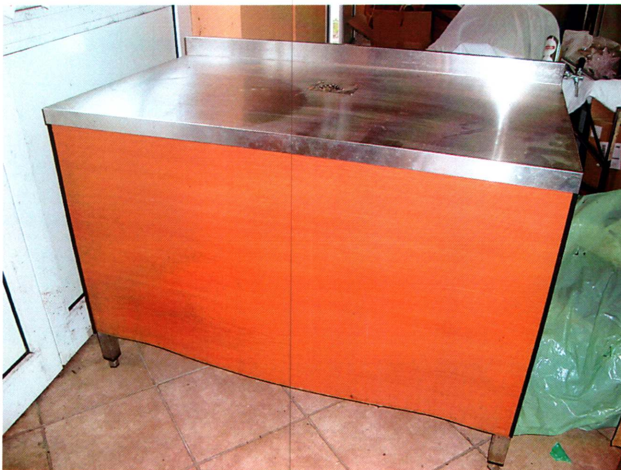
6. RADNI STOL, br.1